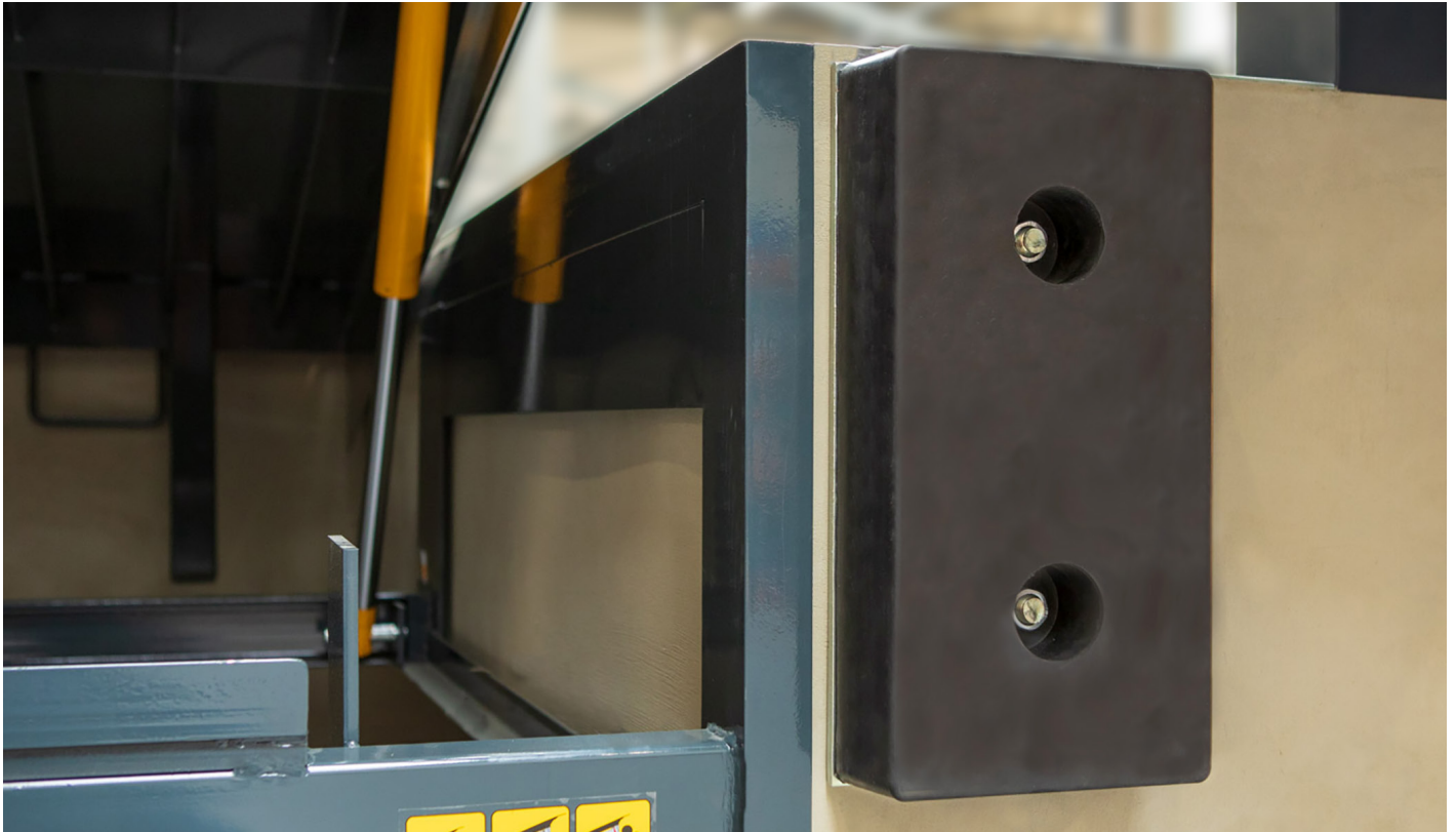
Butoirs en caoutchouc.